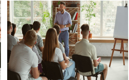
Corporate Academy e Certificazioni Professionali