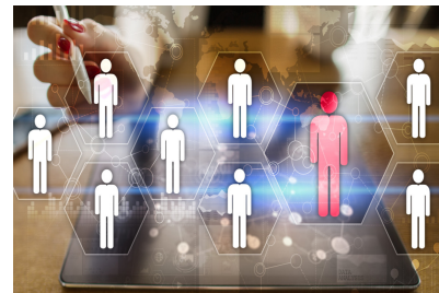
Assessment e Design Organizzativo