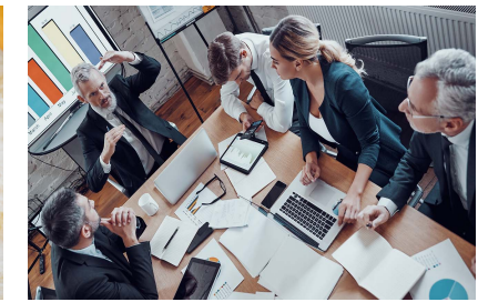
Vendita, Negoziazione e Operazioni Straordinarie