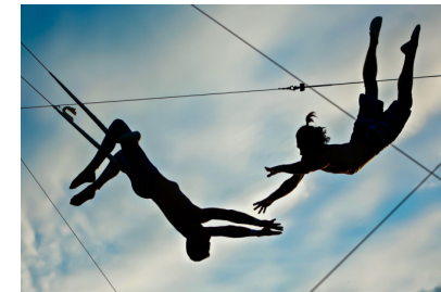
People e Change Management