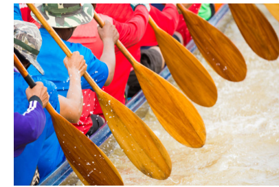
Crescita, Leadership e Team Collaboration