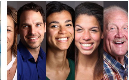
SDG, Welfare e Corporate Emotional Responsibility