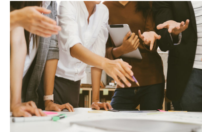
Comunicazione, Branding e Marketing