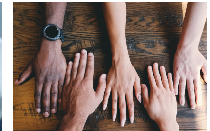
Networking e D&I