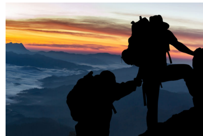
Life Skills e Benessere Organizzativo