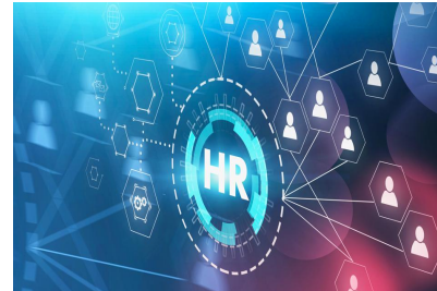
People Analytics e Performance Improvement