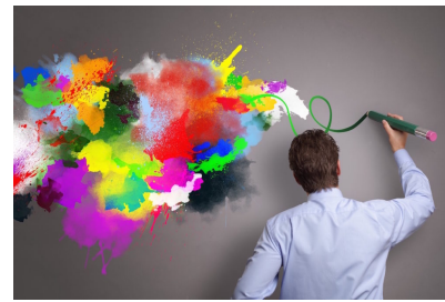
Design Thinking, Creatività ed Innovazione