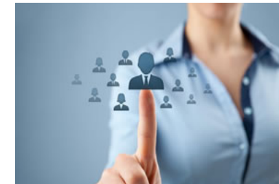
Selezione e Talent Disclose